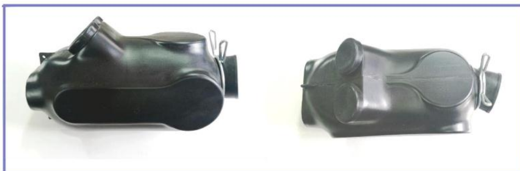
MVR- Modelo 1121